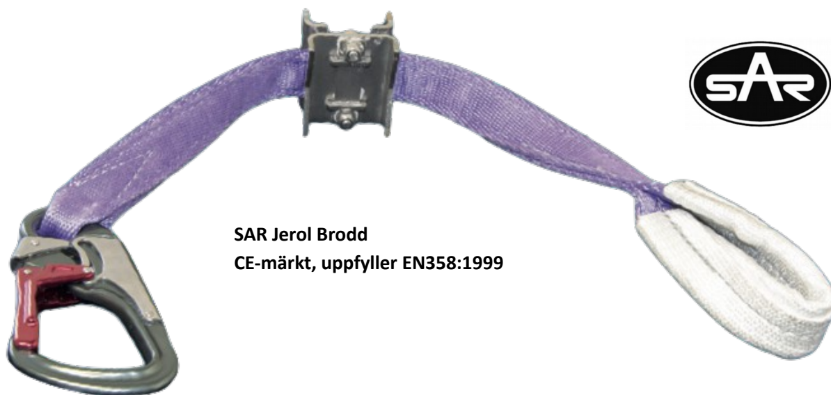
SAR Jerol Brodd CE-märkt, uppfyller EN358:1999