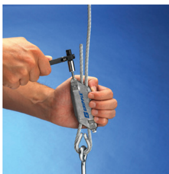
Steg 5 Säkra gripplelåset mot vibrationer genom att dra åt de små M5-skruvorna som medföljer låset.