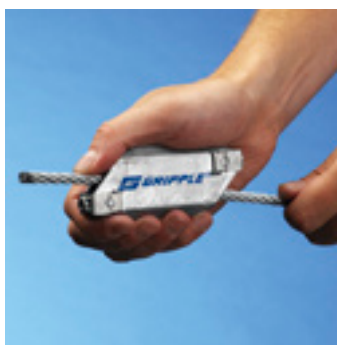
Steg 1 Tryck vajern genom en av kanalerna på låset.