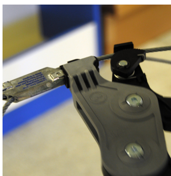
Steg 4 Sätt spännverktyget mot den korta ändan av vajern mot låset och spänn till. Inga problem med långa längder, kraften sitter i verktyget.