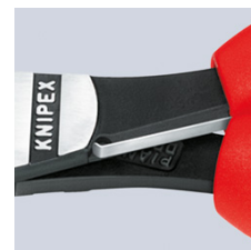
74 12: Öppningsfjäder i deaktiverad position