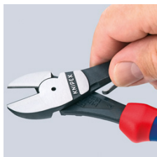
74 12: Öppningsfjäders aktiveras enkelt genom tryck med tummen

Med reservation för tekniska ändringar och fel