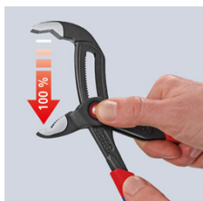
Tryck på knappen - öppna tången helt