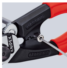
Påpressning av ändhylsor på bowdenhölje