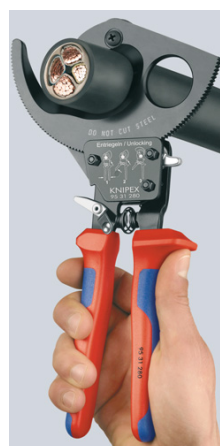
Spärrmekanism och tvåväxlad kugghjulsdraft för kraftsparande klippning