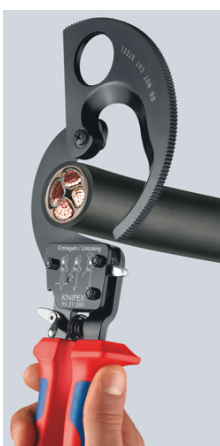
95 31 280: Hög kapacitet: max Ø 52 mm / 380 mm 2