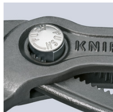
Finjustering med tryckknapp: snabb och komfortabel