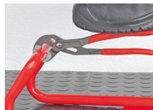
Mot rotationsriktningen förskjutna tänder åstadkommer en självklämmande effekt och förhindrar glidning på arbetsstycket.