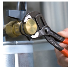
Snabb och exakt inställning direkt på arbetsstycket