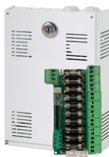
10 output module Mini