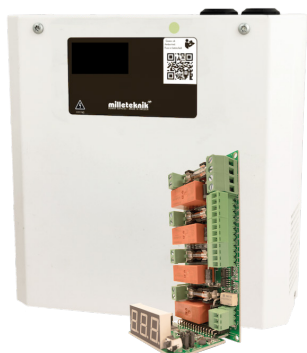
Fire module 4 outputs S