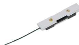
DIN module holder