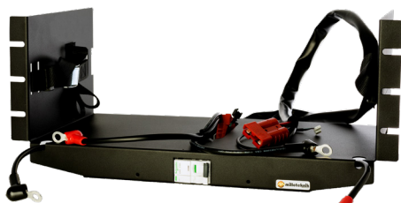
Battery shelf 24V M