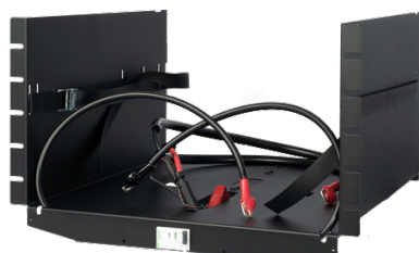
Battery shelf 24V L