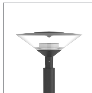
Trygg med bländskydd.