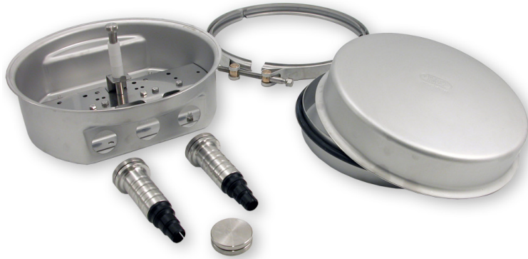
Skarvbox T för fiberoptisk kabel

Skarvbox T ingår i ett modulsystem av låsbara kapslingar tillverkade i syrafast rostfritt stål. Kännetecknande är stor flexibilitet, enkel hantering och täthet för både tryck och vakuum. Kapslingarna lämpar sig väl för krävande miljöer. Med torkmedel förblir boxen fuktfri även under extrema förhållanden.