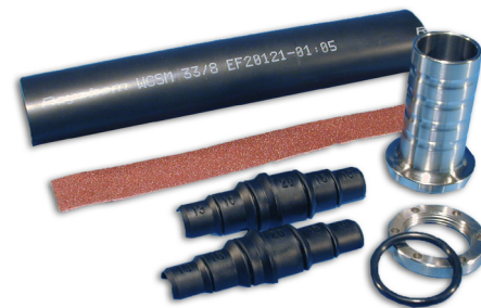
11 212 132 Kabelgenomföring sats 1x24 inkl adapterhylsa kabeldiameter 9 - 24 mm.