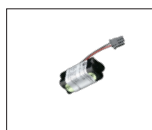
Batteri 4,8 600 mAh 73 83 90