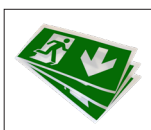
Piktogramset enkelsidig 73 434 28