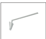
Flaggkonsoll 73 149 43