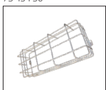
Bollskydd metall 73 416 64