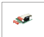
Potentialfri kontakt No/nc 73 483 89