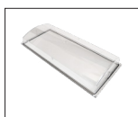
Reservkupa enkelsidig 73 434 27