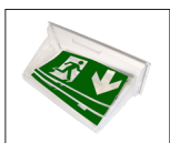
Kupa dubbelsidig inklusive piktogramset 73 434 30