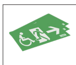
Piktogramset enkelsidig rullstol 73 434 29