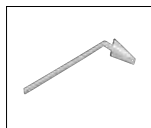
Flaggkonsol 73 149 40