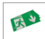
Piktogramset, pil ned 73 417 16