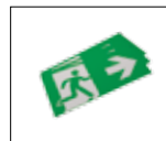
Piktogramset, pil H/V 73 417 15