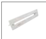
Infällnadsram 73 419 16