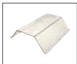
Bollskydd 73 486 36