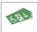
Pikto.set, rullstol pil ned 73 417 18