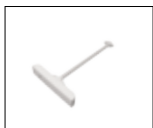
Pendel, silvergrå, 0,5 m 73 417 13