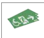
Pikto.set, rullstol H/V 73 417 17