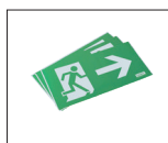
Piktogramset 73 410 84