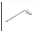
Flaggkonsol 73 149 43