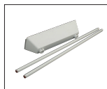
Dubbelpendel, vit, 1,0 m 73 456 64