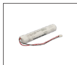
NiMH 3,6V 1,2 Ah 73 410 85