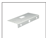
Tak/ pendelkonsol för enkelsidig pendling 73 149 38