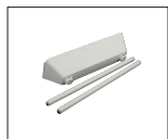
Dubbelpendel, vit, 0,5 m 73 456 63