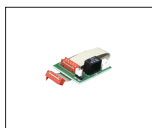
Potentialfri kontakt: 73 483 89