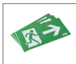
Piktogramset anvisning: 73 416 42