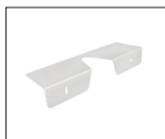
Väggkonsol: 73 408 19