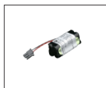
NiMH 4,8V 600mAh: 73 483 90