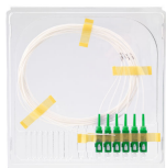
Pigtail SM SC/APC 1,5m 6-pack