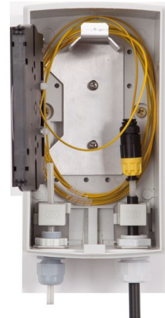
SNM12 skarvbox 12F IP54

Bottenplatta/skyddskåpa beställs separat.